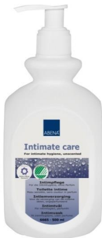
Toilette intime, 500 ml. Réf: 6665

ABENA Abena-Frantex SA 5 rue Thomas Edison 60180 Nogent-sur-Oise